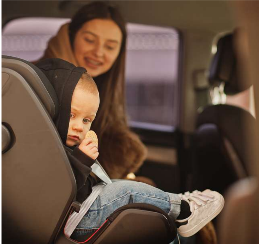
Sicher unterwegs: In der Schweiz gilt Kindersitz-Pflicht bis zum 12. Lebensjahr.