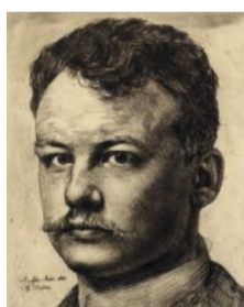
Karl Stauffer-Bern (1857–1891) Genie und Tragik