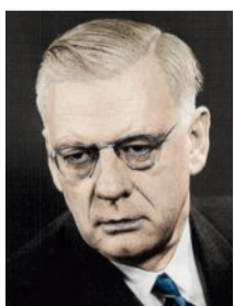
Markus Feldmann (1897–1958) Gegen braune und rote Fäuste