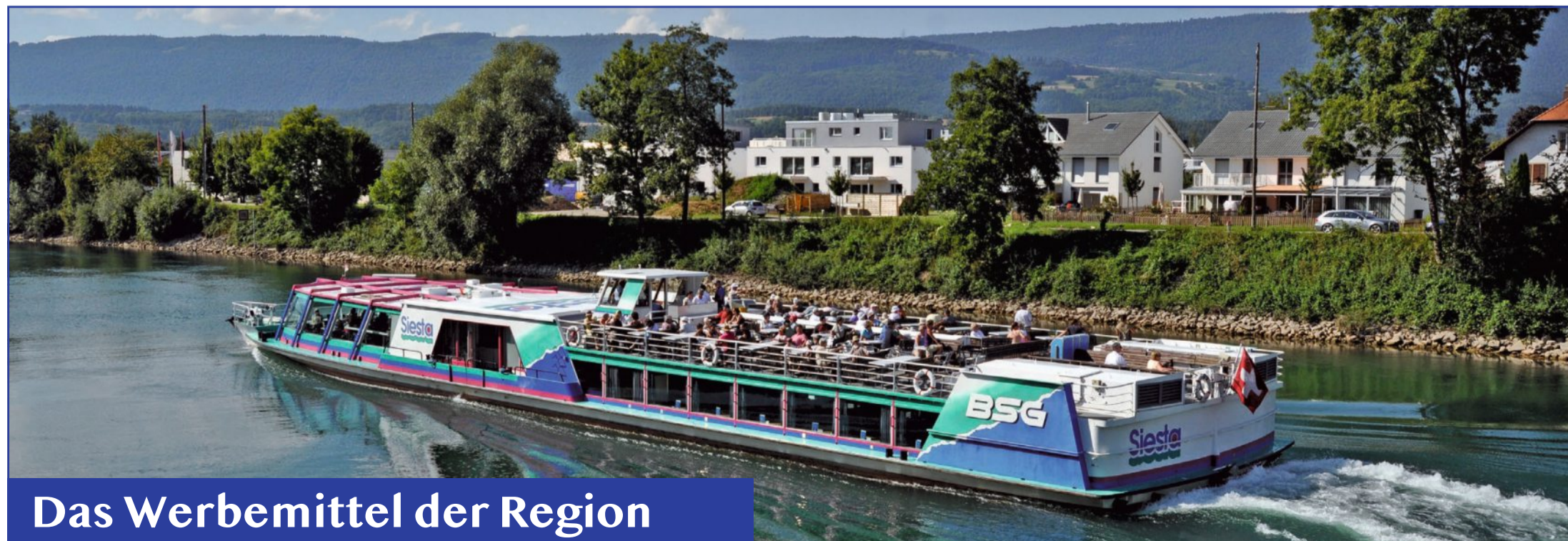
Das Werbemittel der Region