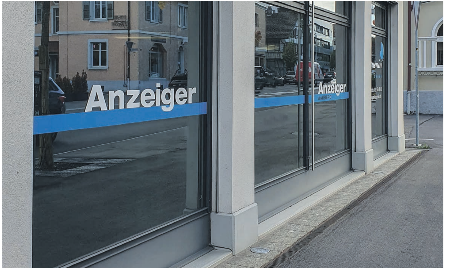
Das Büro des Anzeiger Büren und Anzeiger Aarberg in Lyss.

Die Bilder werden bei genügend Platz publiziert.