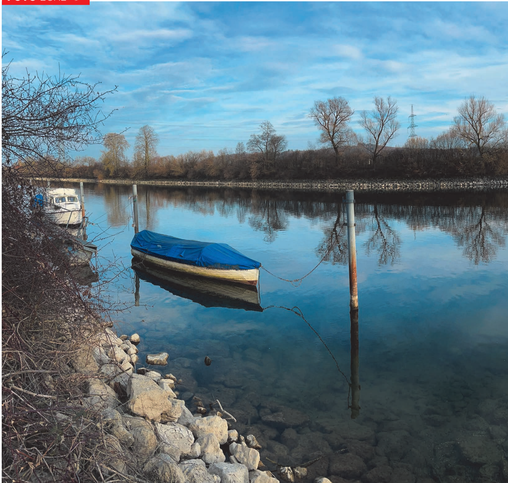
Spiegelung mit Schiffli.