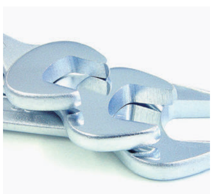
Wir sind bereit!