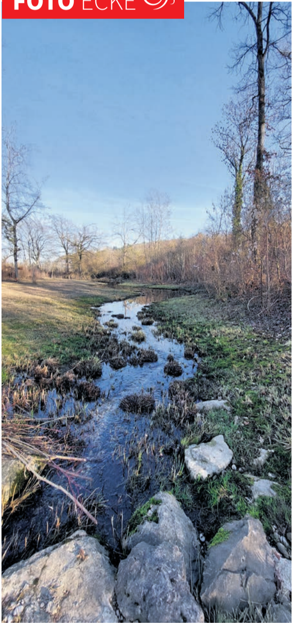
Nachmittagsspaziergang in Dotzigen an der alten Aare.

Zu vermieten an der neuen Bahnhofstrasse 17 in 3297 Leuzigen an Nidtraucher