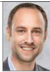
Christian Wasserfallen Nationalrat FDP, BE